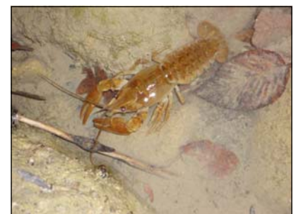
Fig. 3. Individuo adulto di A. pallipes rinvenuto nel Bacino del Sangro.