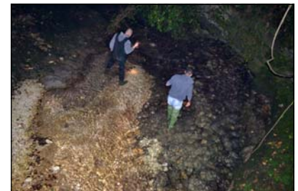
Fig. 2. Censimento astacicolo manuale in notturna.

Le analisi statistiche sono state eseguite mediante Test U di Mann-Whitney (Jandel SigmaStat - vers. 8.0). In ogni sito, sono stati misurati alcuni parametri chimico-fisici delle acque mediante sonde multiparametriche (HQ40d multi HACH; WTW Multi 340i AQUATIC ECOSYSTEMS) ed è stato determinato l' Habitat Assessment (%HA, BARBOUR et al. , 1999). Mediante GPS sono state rilevate le coordinate geografiche dei siti investigati. Sono stati inoltre, raccolti alcuni campioni di gambero (pereiopodi) per la successiva caratterizzazione genetica ed il corretto inquadramento tassonomico. Le attività di campo sono state precedute dall'analisi della letteratura e della cartografia e da sopralluoghi preliminari.