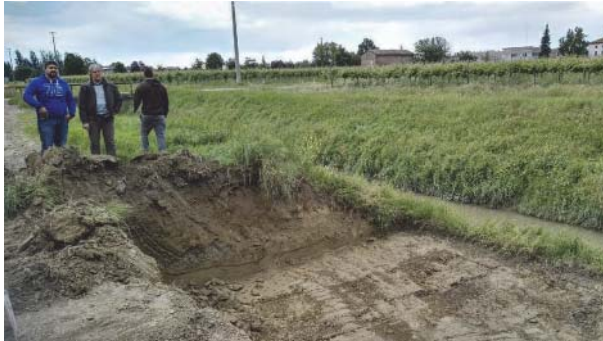
Fig. 10. Diversivo Fossa Nuova Cavata. A sinistra: particolare dell'approfondimento della banchina per la creazione della golena allagabile. A destra: la golena creata a fine lavori. Si notino gli shelter a protezione della vegetazione posizionati lungo la sponda del canale, su due file.

creare una golena allagabile lineare di circa 900 m di lunghezza e 6 m di ampiezza, la forestazione di circa 900 m di sponda e la conservazione della vegetazione acquatica su 900 m di canale.