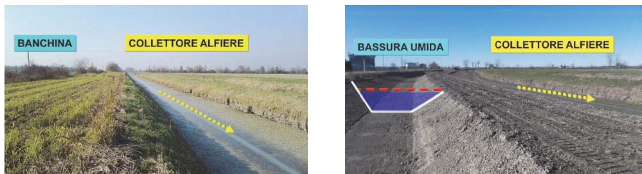
Fig. 3. Collettore Alfieri, Tratto 1. A sinistra: pre-intervento (vista da valle verso monte). A destra: post intervento (vista da valle verso monte), subito dopo la fine dei lavori.

Nelle figure 2-6 è possibile apprezzare le fasi di lavoro e le prime piene che hanno interessato il canale dopo l'esecuzione dei lavori. È ora in corso la colonizzazione da parte della vegetazione spontanea acquatica e lo sviluppo della vegetazione riparia appositamente