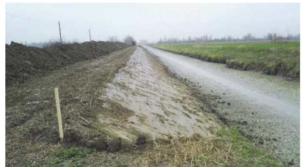
Fig. 6. Collettore Alfiere nel Tratto 2 durante i lavori. Riprofilatura della sponda al fine di garantire una pendenza della scarpata non superiore a 1:2 e favorire così la colonizzazione di specie elofitiche.

messa a dimora, a circa 6 mesi (settembre 2016) dal termine dei lavori.