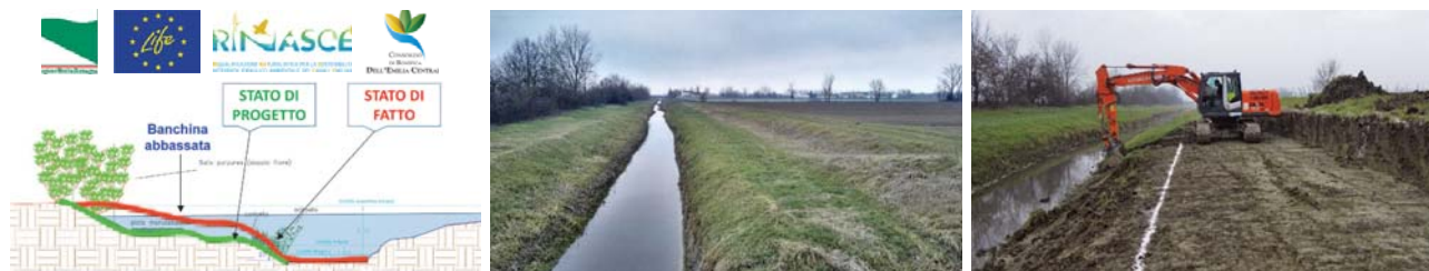
Fig. 7. CABM. A sinistra , schema di progetto: la banchina presente all'interno del canale, allagabile raramente, è stata ribassata per aumentare la frequenza di allagamento e per favorirne l'evoluzione ecologica. Al centro : Tratto 1 pre-intervento (vista da valle verso monte); sulla destra la banchina da ribassare. A destra : Tratto 1 durante i lavori (vista da valle verso monte): la banchina in corso di scavo per creare una golenia allagabile.