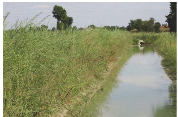
Fig. 5. A sinistra: Collettore Alfiere nel tratto 1 a circa 6 mesi dalla fine dei lavori; sponda destra arretrata e riprofilata al fine di garantire una pendenza della scarpata non superiore a 1:2 e favorire così la colonizzazione di specie elofitiche. A destra: particolare di una bassura umida, in cui si nota la colonizzazione in corso da parte della vegetazione.