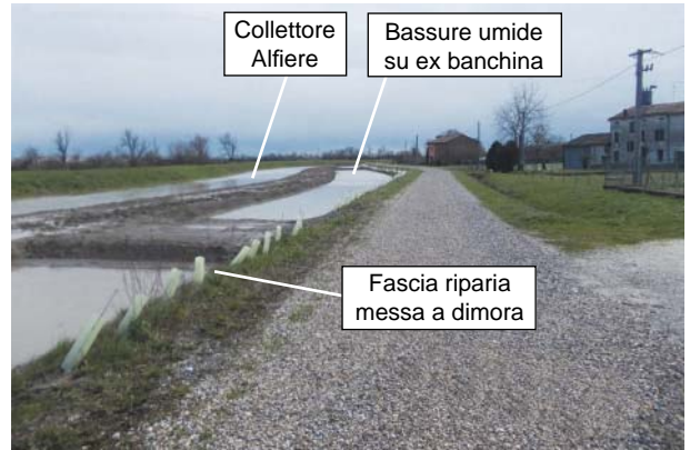
Fig. 4. Bassura umida del Collettore Alfiere dopo la fine dei lavori, durante la piena del 18 febbraio 2016 ( a sinistra ) e dopo la piena del 3 marzo 2016 ( a destra ).