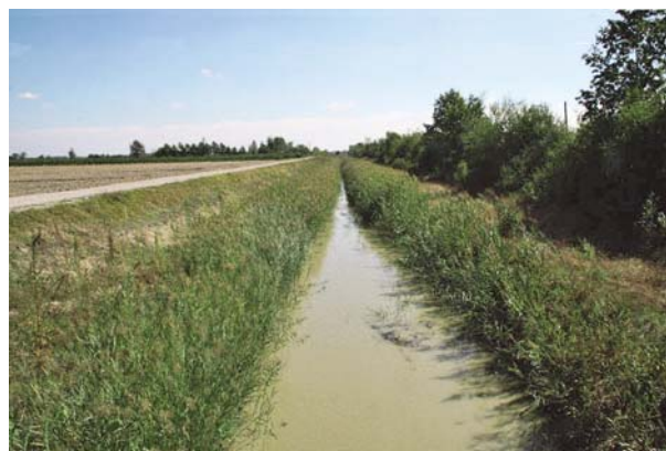
Fig. 8. A sinistra : CABM – Tratto 1 - Post piena del 10 febbraio 2016: la golenia scavata è stata allagata dalla prima piena. Ancora la vegetazione non si è sviluppata. Si noti la banchina sul lato opposto non interessata dalla piena a causa dell'altezza superiore alla golenia ribassata. A destra : CABM nel tratto 1 il 06/09/2016, a 7 mesi dal termine dei lavori: si noti la colonizzazione da parte della vegetazione elofitica.

a quanto già esposto per il Collettore Alfieri: