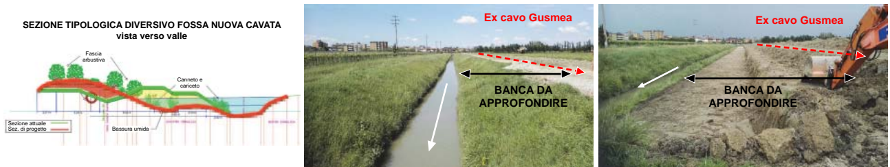
Fig. 9. Diversivo Fossa Nuova Cavata. A sinistra: schema di progetto. Al centro: la banca da approfondire tra il Cavo Gusmea tombato e il Diversivo Fossa Nuova Cavata (in primo piano). A destra: inizio dei lavori di scavo della golena allagabile.